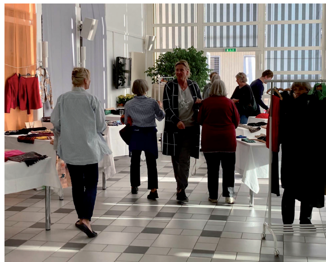
Modebewusste Ladies treffen sich an der «Stalliker Wybergant», der geselligen Kleider-Tausch-Party, bei der man Budget und Umwelt schont und dabei Gutes tut.

GV der Genossenschaft Kafimüli Stallikon, 28. Juni