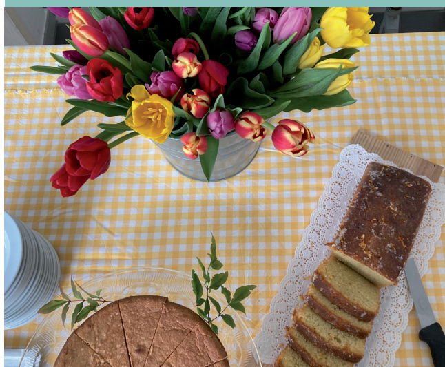
Die freiwilligen Helferinnen und Helfer sowie das RgZ-Team tragen dazu bei, dass sich die Gäste bei unseren Veranstaltungen wohlfühlen.