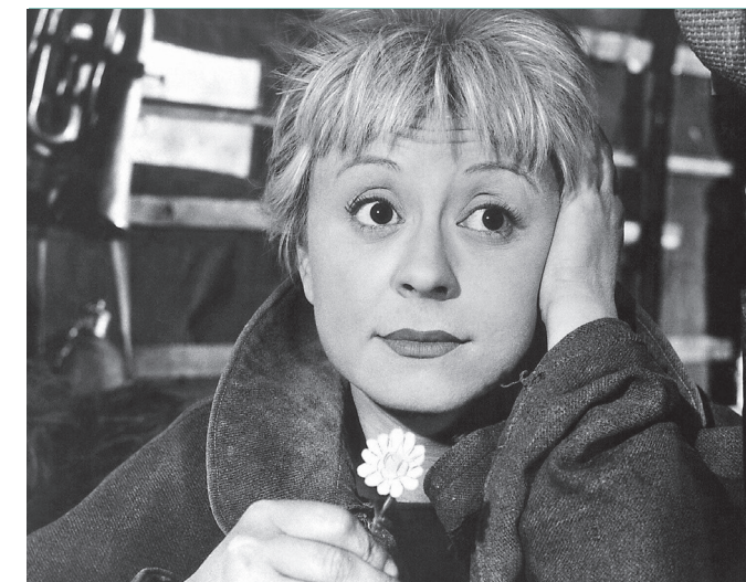
«La Strada» von Federico Fellini war einer der Filme, die 2022 im improvisierten Kino Kafimüli gezeigt wurden.

Das Kafimüli-Team funktioniert und ergänzt sich als heterogen gemischtes Team sehr gut und kann inzwischen auf routinierte, freiwillige Helferinnen und Helfer zählen. Nur so ist es möglich,