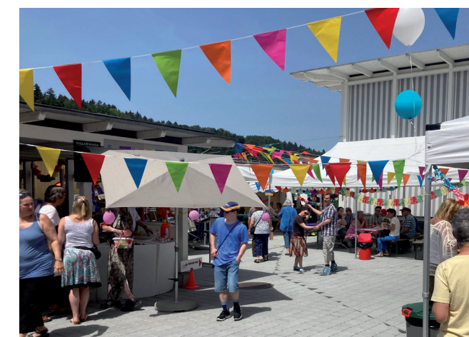
Bei hochsommerlichem Wetter wurde am 18. und 19. Juni im Wohnheim Loomatt gefeiert: Das 25. Loomattfest und ein Jahr Kafimüli@RgZ.