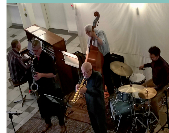
Für ein stimmungsvolles Konzert sorgten die fünf Musiker des Jazz Quintetts «Die Quintenphysiker» am 30. April.