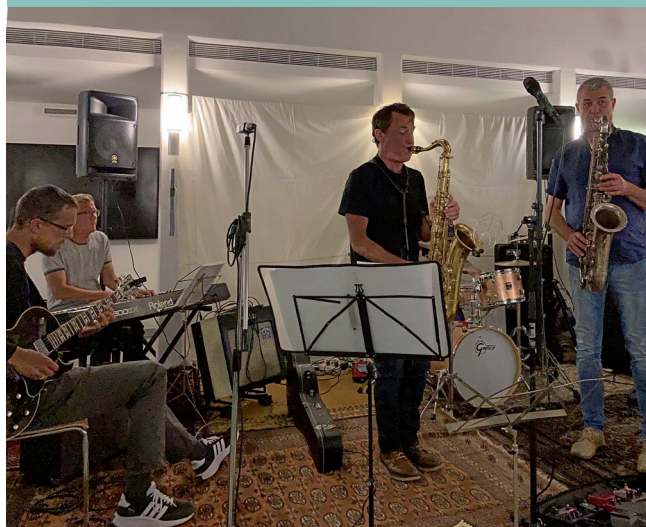
Die Konzerte mit anschliessender Jam Session bieten Amateurmusikerinnen und -musikern aus der Region Gelegenheit, miteinander zu «jamen».